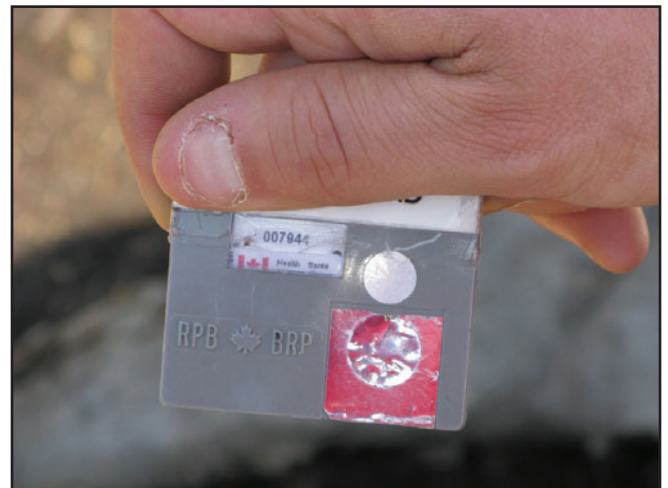
OtanattutattuKagajammangat kamagijaunginnatuk atuKattaniammata kamautimmik otanattutattuKagajammangat taijaujumik thermoluminescent dosimeter (TLD pakallak) TLD pakallak KimiggutauKattajut ammalu Kaujjaujut kamagijauKattajut Inositsiagit-totigasuaattuligijikkinnut Canadami.

Ilonnaini Kâjotsatalinik ujugannianimi, inuit ammalu avatet atuttauniKasot otânnatulinnut. Tamakkua ilangani sukkuilagisongungitut , piluattumik ujuganniavimmi Michelin Project. Taimaigaluattillugu, ikKanammagikKuk kamatsiagamik inuit otâttailikKulugit. Tamanna kamagijausok inuit kamatsiakullugit otânnatunik ammalu, pigunnagutik, sunanik âkKisuillutik apvialutaugajattunik akungani inuit ammalu sukunattutalet. Tâkkua piusiujut sakKititsisimajut unuttuni jârini otânnatuit atuinniKatsianianginginnik inuit inogusinginnik.